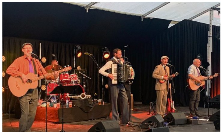
Og torsdag går ferden videre til Stormfestivalen for Brødrene Fosenmomo.

motstandere. Men da vi antyder overfor Åge at han kanskje, som Frøyafestivalen, er nøytral i denne lokalt betente saken, får vi kontant kontrabeskjed: