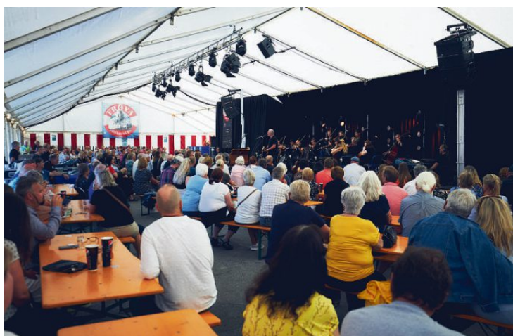
Tettere enn dette får du ikke ha en konsertarena sommeren 2020.